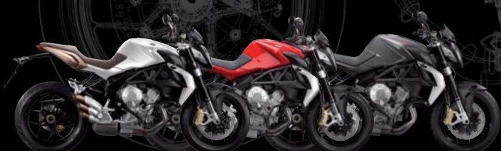
BLANC PERLE/OR MÉTALLISÉ MAT